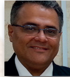
Abdelfattah Saoud Mısır